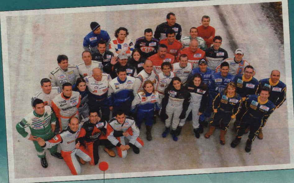
Toute la troupe en piste dès samedi à Val-Thorens.

Avoir un quadruple champion du monde de la F1 et un présentateur de télévision au départ de la même course, il n'y a que sur le Trophée Andros que l'on peut voir ça.