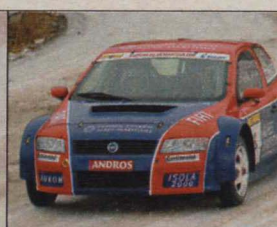
Fiat : Pernaut et Lagorce.