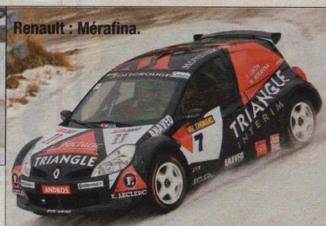
Renault : Mérafina.